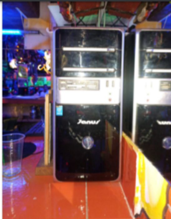
Fotografía No. 15. CPU de computador marca JANUS