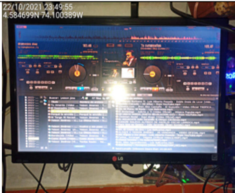
Fotografía No. 16. Monitor (LG) de computador marca JANUS